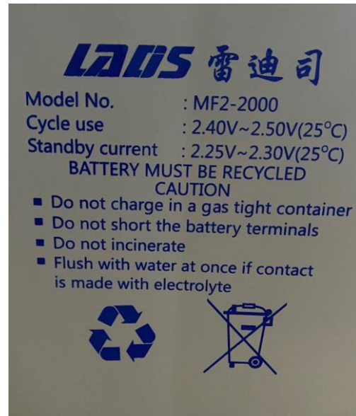
MF2-2000 (2V 2000Ah) 阀控式密封铅酸蓄电池